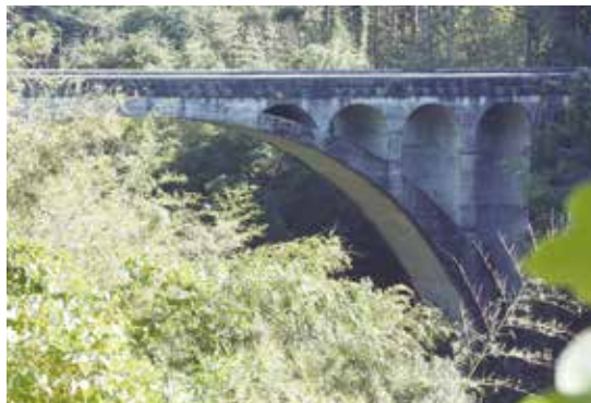
1 竜原橋 たつはるはし