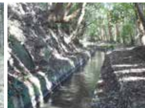
世利川井路せりがわいる