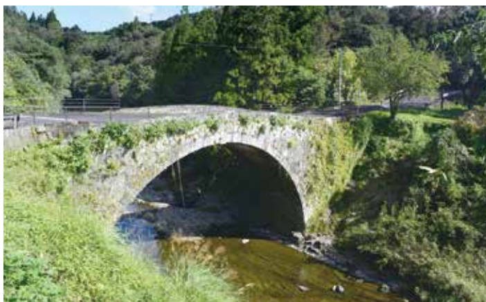
6 虹澗橋 こうかんきょう