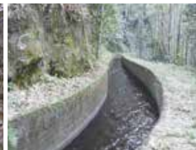
堤子井路ひさごいろ