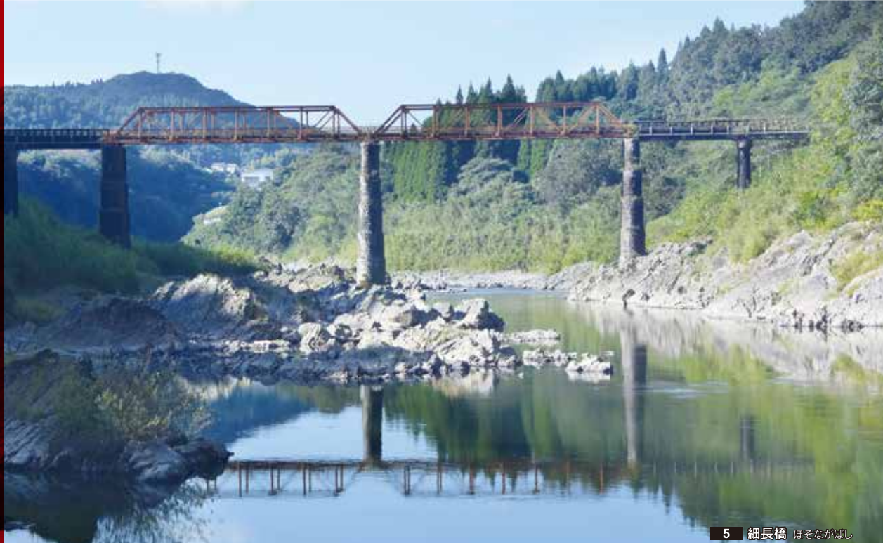
5 細長橋 ほそながばし

JR九州の久大本線と豊肥本線に囲まれて広がる奥豊後路は、豊かな森林と耕地に恵まれた美しい故郷です。豊後の鶴崎と肥後の熊本を結ぶ豊後街道が、その中程を貫きながら、歴史の歩みと懐かしい情趣を今に伝え、大野川をはじめとする幾多の河川が大地を潤し、多彩な産業と暮らしの基盤を強固に支えています。