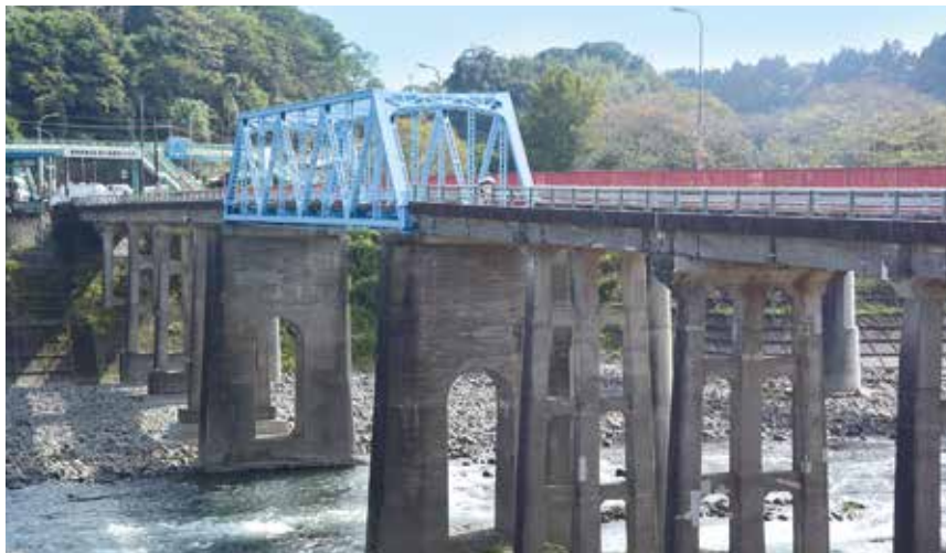
4 (旧)犬飼橋 (きゅう)いぬかいはし

ひさご のつはるさんきよ 利川・堤子の石張水路・野津原三渠 2 を掘削完成させ、広大な新田開発を実現したのです。