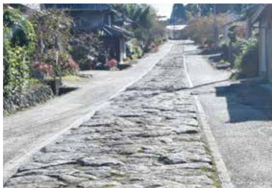
3 今市石畳 いまいちいしだたみ