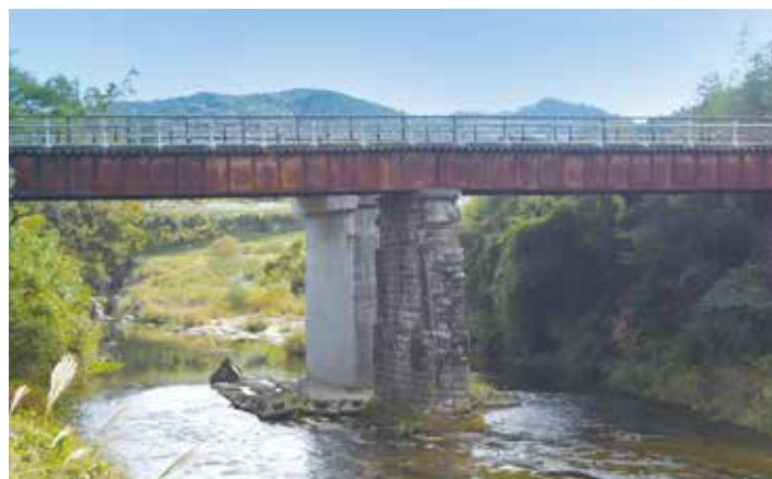
7 (旧)明治橋 (きゅう)めいじはし

やかな印象です。左右のトラス構造の上部が連結されていないポニーワーレントラス橋であり、明るいオレンジ色が洒落です。橋梁を支える石造りの巨大な橋脚は5段構造で、どっしりと重厚感にあふれています。この細長橋の周辺は、かつて大野川の船着き場として繁栄していた歴史があるそうです。現在は老朽化のため、通行止めとなっています。