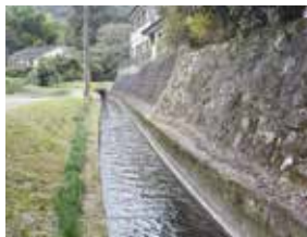
大龍井路おたついる